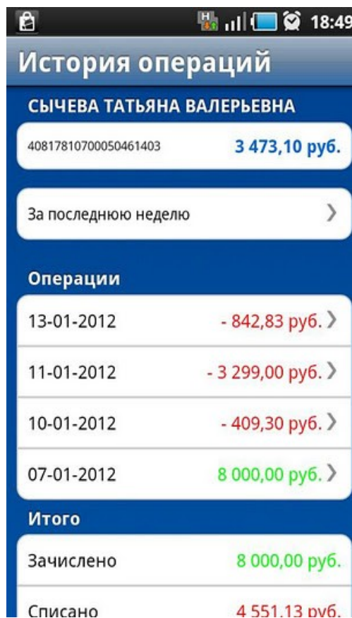
Рис.4 – История операций