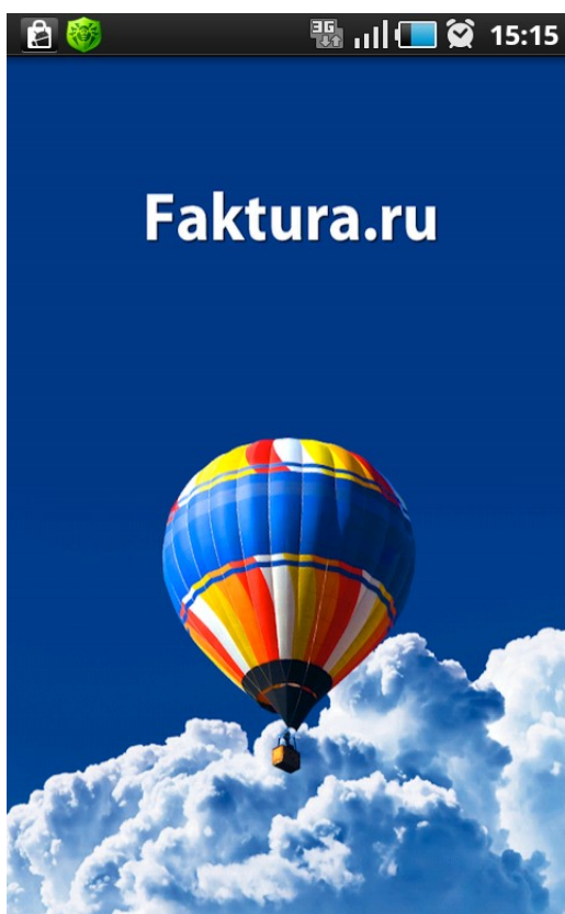
Рис.1 – Первая страница