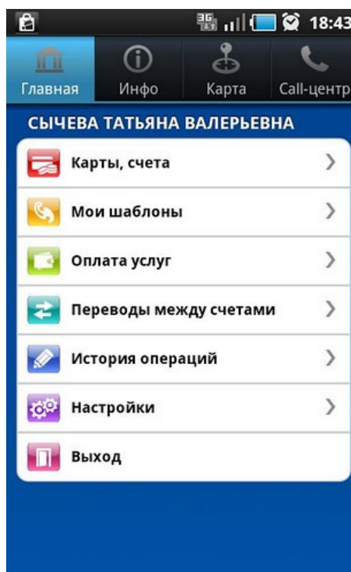
Рис.2 – Меню приложения